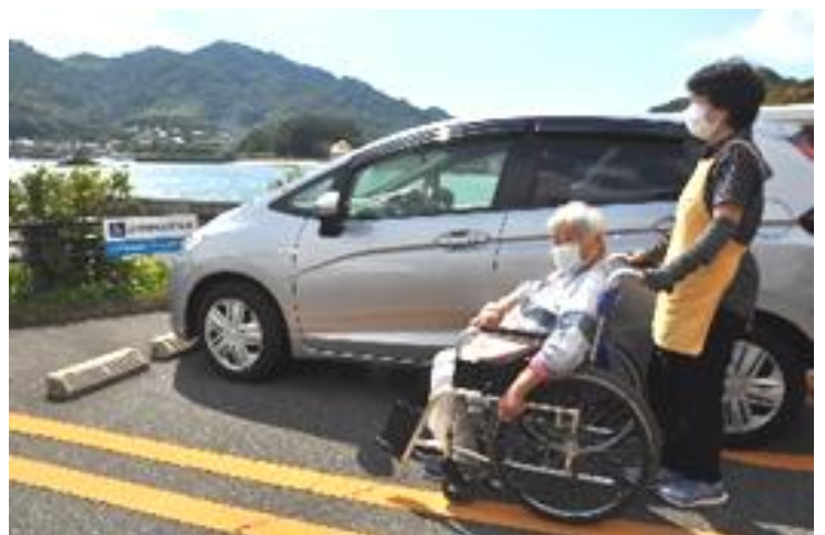
病院の駐車場にて。「いい天気ですね!」「ほんまじゃなあ～」